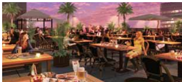
Aloha HAWAIIAN BEER GARDEN 【アロハハワイアンビアガーデン】

2012年6月、川崎駅の川崎アトレ屋上にオープンしたビアガーデン。駅ビルの屋上といった立地から気軽にご利用いただけ、店名の通りハワイアンリゾート気分満載でお楽しみいただけます。