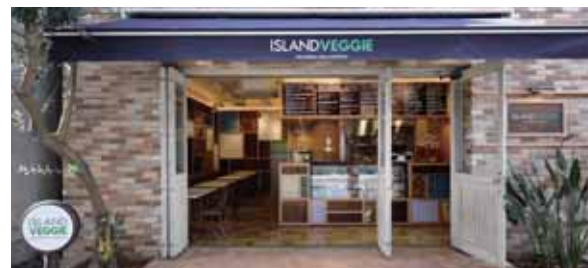
ISLAND VEGGIE × SANBONZON 【アイランドベジ × サンボン・アサイーカフェ】

2013年5月、広尾に「サンボン」アサイーカフェとのコラボショップをオープンいたしました。カリフォルニア「アサイーカフェ」のレシピを忠実に再現したアサイーボウルやスムージー、オリジナルベジバーガーをお楽しみ頂けます。