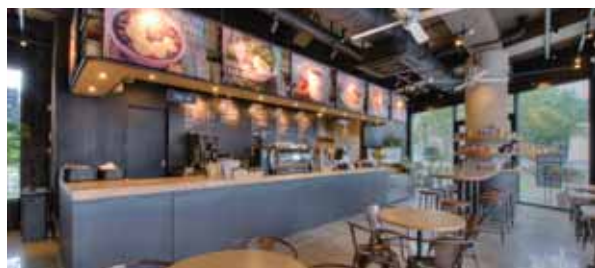
ALOHA TABLE 【アロハテーブル 清潭】

■住所 神奈川県川崎市川崎区駅前本町 26-1 アトレ川崎 6F 屋上 ■TEL 044-589-3616 ■OPEN 16:00-23:00 ■CLOSE 天候により休業する場合があります