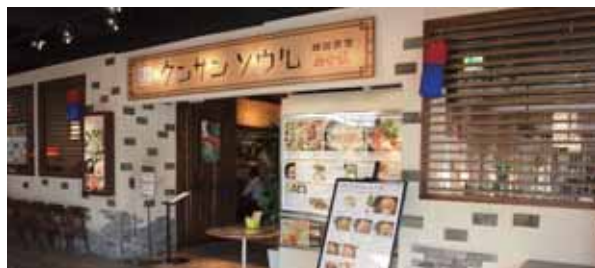
クンサン ソウル 韓国食堂 【韓国食堂クンサンソウル】

■住所 1F, ANNEX Adong SB tower 318 Dosan-daero Gangnam Gu, Seoul, Korea ■TEL +82-2-546-7718 ■OPEN 8:00-23:00 (土・日 11:00-23:00) ■CLOSE 不定休