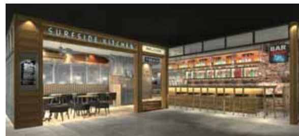
SURFSIDE KITCHEN 【サーフサイドキッチン】

■住所 東京都渋谷区広尾 5-3-9 CASビル 1F ■TEL 03-6277-0962 ■OPEN 08:00-19:00 ■CLOSE 不定休