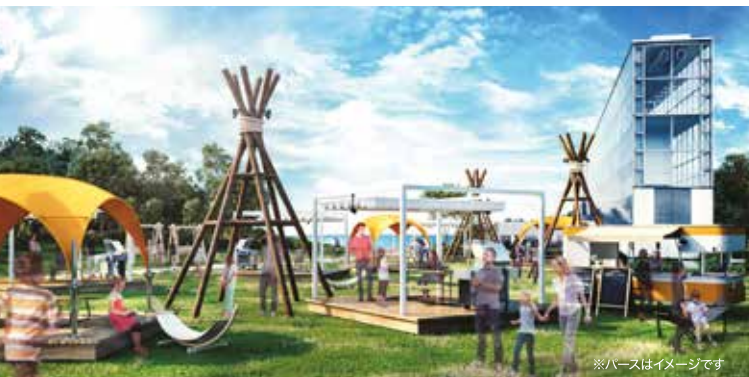
※ハースはイメージです