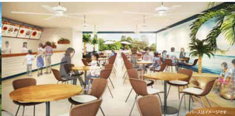
※ハースはイメージです