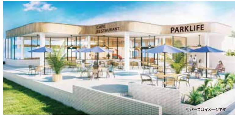
※パースはイメージです

REDEVELOPMENT PROJECT of KASAI RINKAI PARK