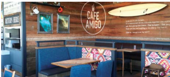
CAFE AMIGO 【カフェアミーゴ】

2015年12月、東京都立川市にオープンした複合型商業施設「ららばーと立川立飛」に新業態カフェ・ダイニング「カフェアミーゴ」がオープンいたしました。カジュアルな雰囲気の内店は、ランチやカフェ、軽食・パールとしてもお使いいただけます。