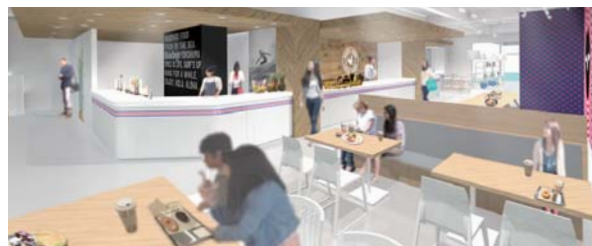
Aloha Amigo 【アロハアミーゴ フードスタンド】

横浜みなとみらい21の商業施設『MARINE & WALK YOKOHAMA』内セレクトショップ「Fred Segal」に、アロハアミーゴをフードスタンドとしてオープンいたしました。アミーゴ名物スイーツ「チミチャング」や、「ミニバンクーキ・サンデー」などラインナップ豊富にご提供いたします。