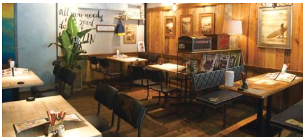
ALOHA TABLE 【アロハテーブル 大崎】

2015年秋に完成した「パークシティ大崎」にアロハテーブルをオープンいたしました。公園に面した開放的なテラスや、パースペース、ダイニングスペースで、プレートランチや新登場スイーツなど多彩なメニューをお楽しみいただけます。