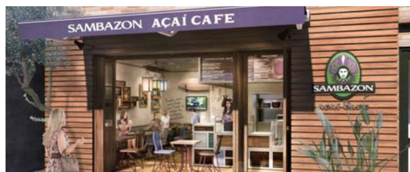
SAMBAZON 【サンバゾン・アサイーカフェ】

2016年4月、広尾「ISLAND VEGGIE」が、SAMBAZON AÇAÍ CAFEとしてオープンいたしました。豊富な栄養素を含む「アサイー」のグローバル・ブランド「サンバゾン」のオフィシャルカフェで、モーニングセットなど幅広くお楽しみいただけます。