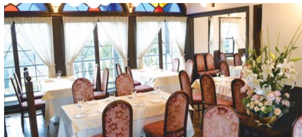
山手十番館 【山手十番館 レストラン&カフェ】

昭和42年に明治100年を記念して建てられた「山手十番館」を、カフェ&レストランとしてオープンいたしました。1階はカフェ、2階はフレンチレストランとしてランチとディナーをお楽しみいただけます。