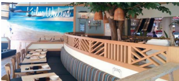
Kailua Weekend 【カイルアウィークエンド 海老名】

2015年10月、ららばーと海老名に「カイルアウィークエンド」がオープンいたしました。開放的なテラスやゆったリソファのくつろぎ空間で、素材にこだわったオーガニックでヘルシーなハワイアンディッシュをお楽しみいただけます。